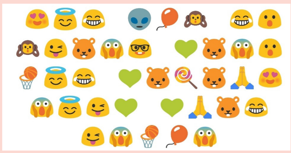
TABLEAU DE DÉCODAGE DU MESSAGE

Qu'a demandé Avraham à son serviteur? Décodez ce message pour le découvrir !